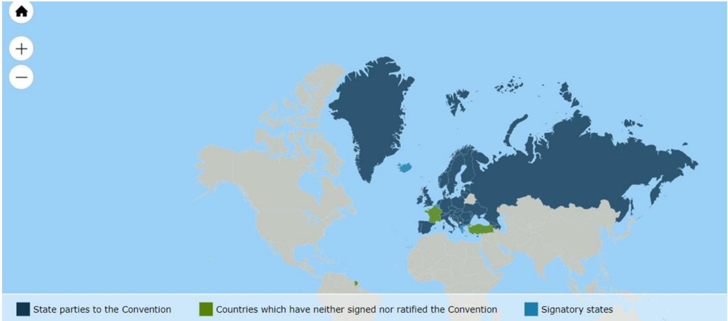
Abbildung 5: Vertragsstaaten