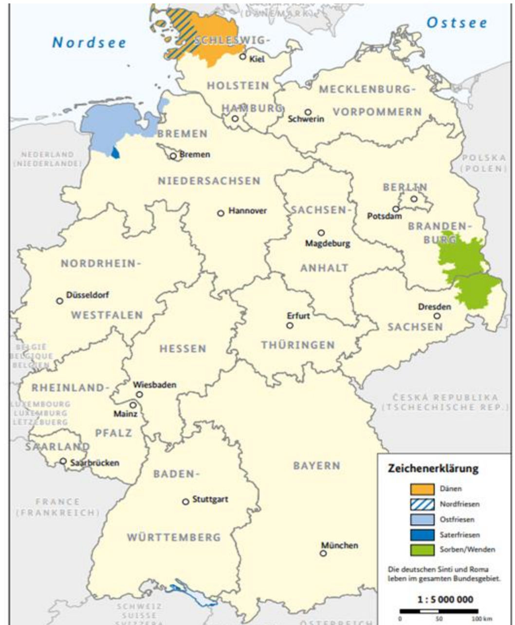
Abbildung 3: Siedlungsgebiete der Nationalen Minderheiten in Deutschland