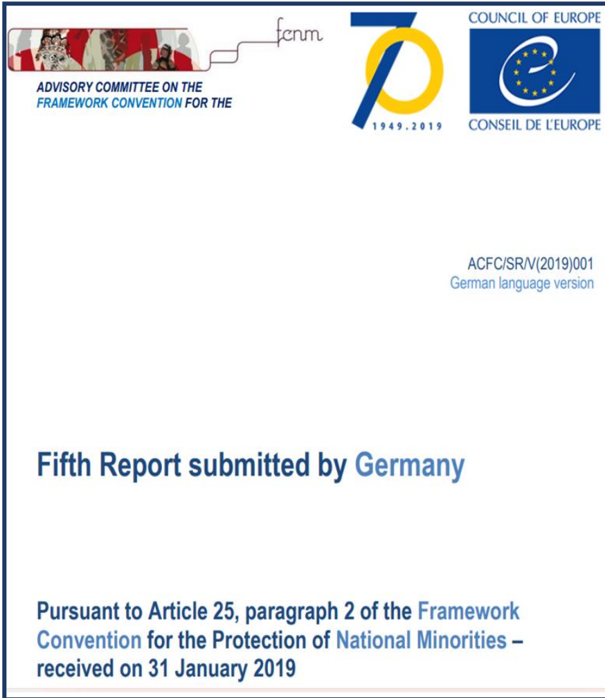
Abbildung 6: Fünfter Bericht