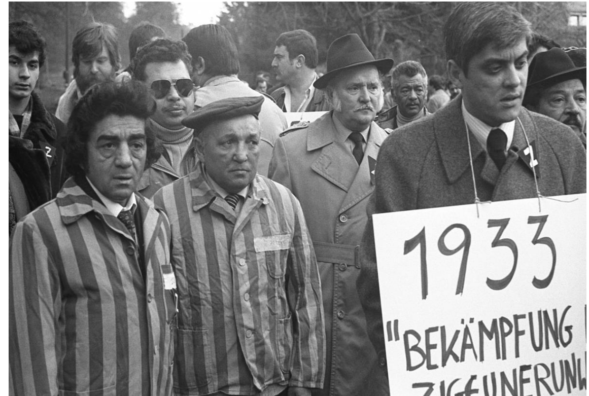
Abbildung 1: Nationalsozialismus