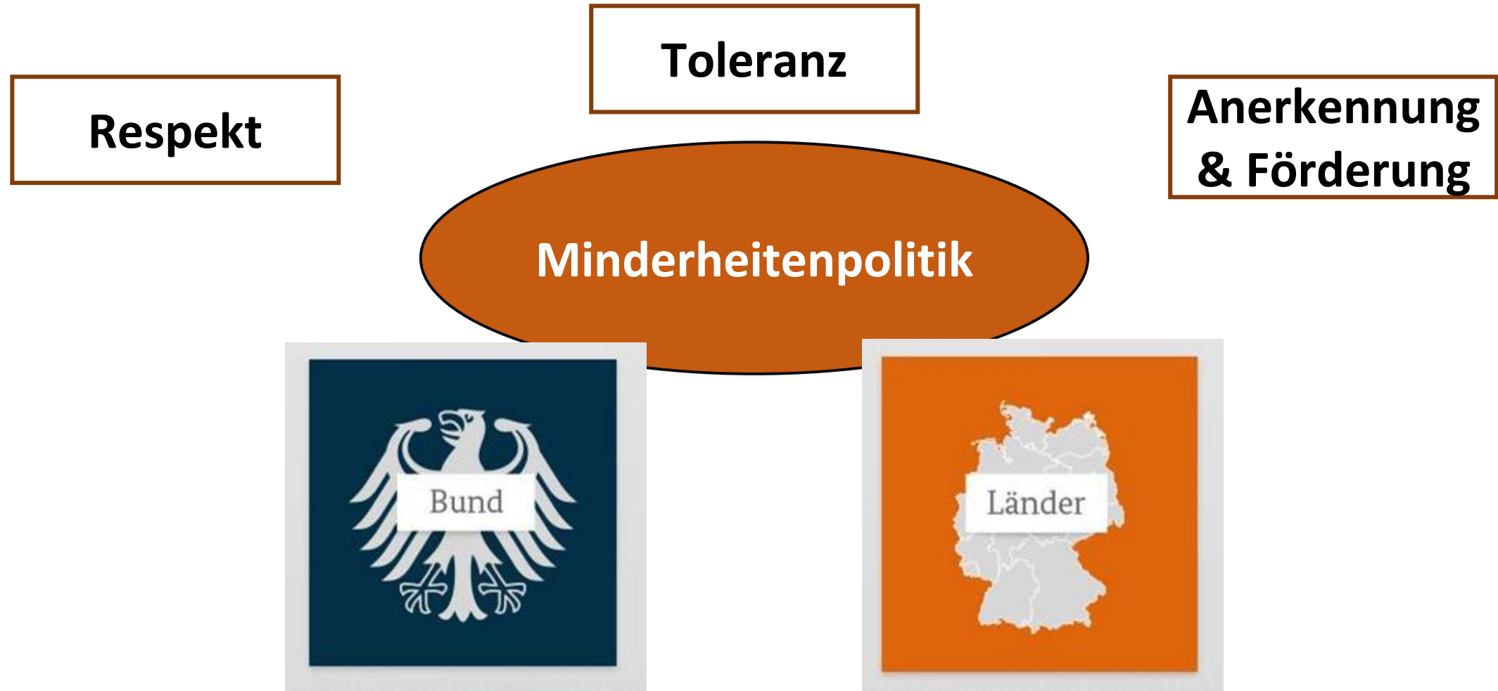
Abbildung 4: Bund und Land