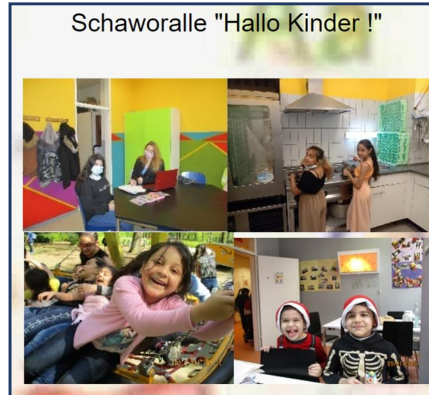
Abbildung 7: „Schaworalle“