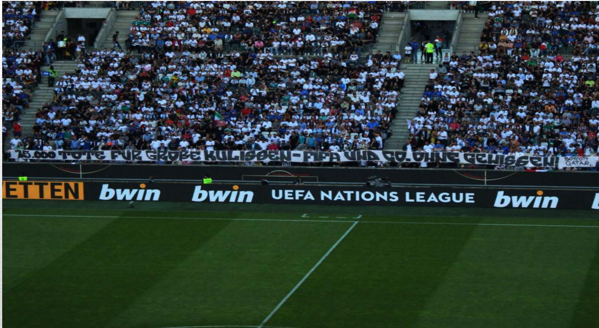
Spiel: Deutschland – Italien (Nation League 14.06.2022)